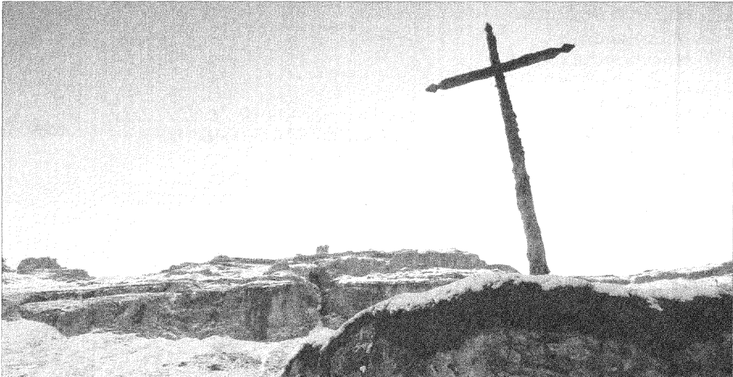
Der Film «Arme Seelen» lebt von eindrücklichen Landschaftsaufnahmen.

len sie jedoch für die Menschen, so- fern man ihnen mit Respekt, Stand- festigkeit und Wohlwollen begeg- net, nicht gefährlich sein. [maf]